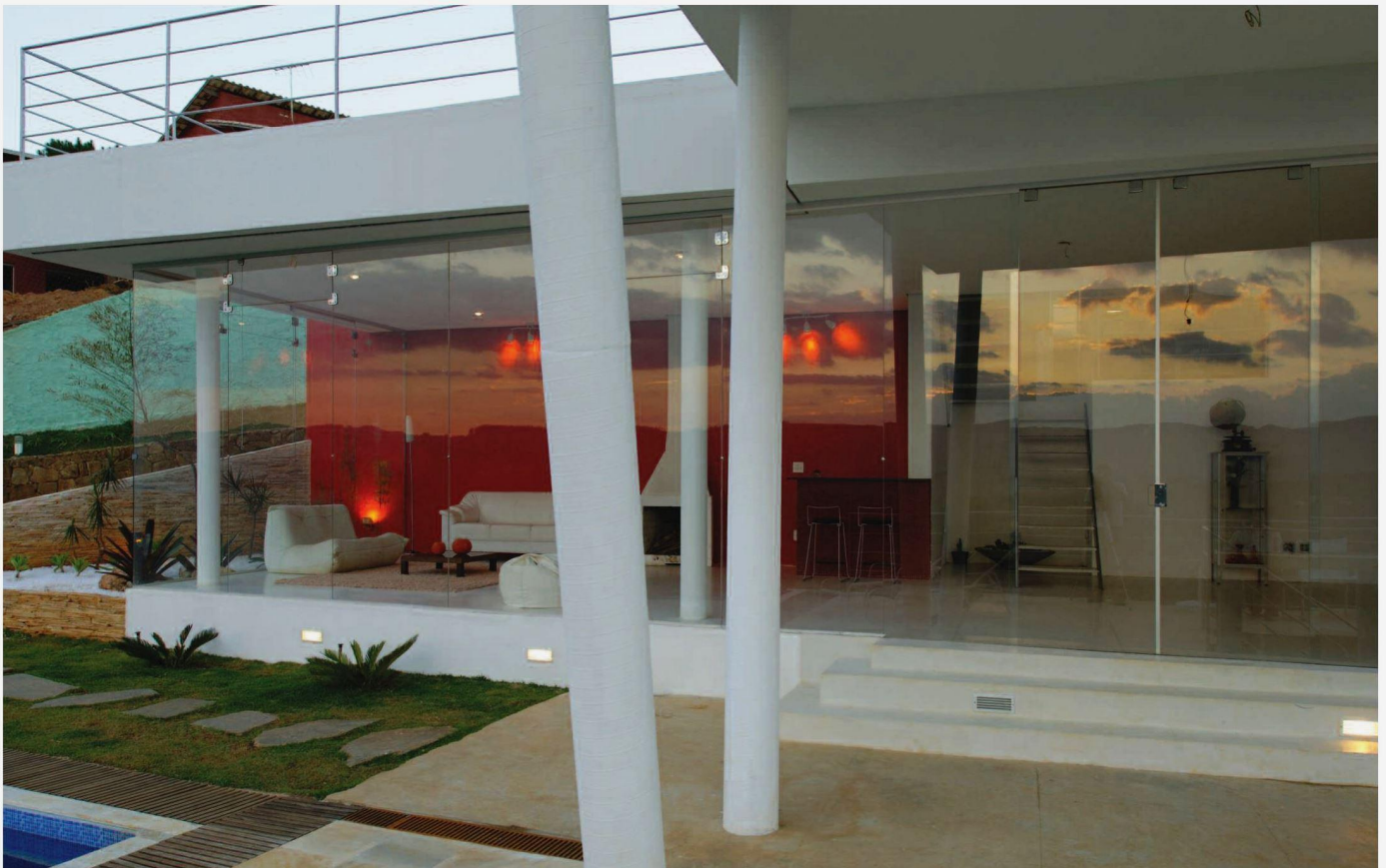
PÁG. OPUESTA: ESTA IMAGEN REFLEJA EN PARTE EL ENCLAVE GEOGRÁFICO EN EL QUE SE ENCUENTRA ESTA RESIDENCIA. MONTAÑAS Y VALLES CREAN UN FONDO MÁGICO A UNA ARQUITECTURA EN LA QUE PREDOMINAN LOS GRANDES ESPACIOS Y EL BLANCO DE LA ESTRUCTURA Y DE LAS DELICADAS COLUMNAS. ARRIBA: EL COLOR ROJO DE LA PARED DEL GRAN SALÓN SE REPITE EN ALGUNOS DETALLES EN LA DECORACIÓN, COMO EN LAS DOS VASIJAS QUE SE ENCUENTRAN EN LA MESITA DEL CENTRO QUE VEMOS EN LA FOTO INFERIOR.